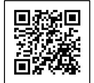
受講料等申込フォーム

受講料等申込フォーム https://srv4.asp-bridge.net/chuo-u/input/